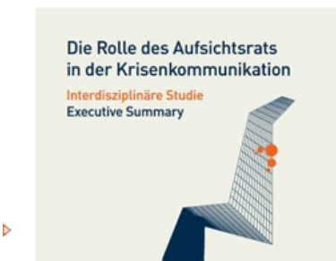
Krisenkommunikation: Was kann, soll und