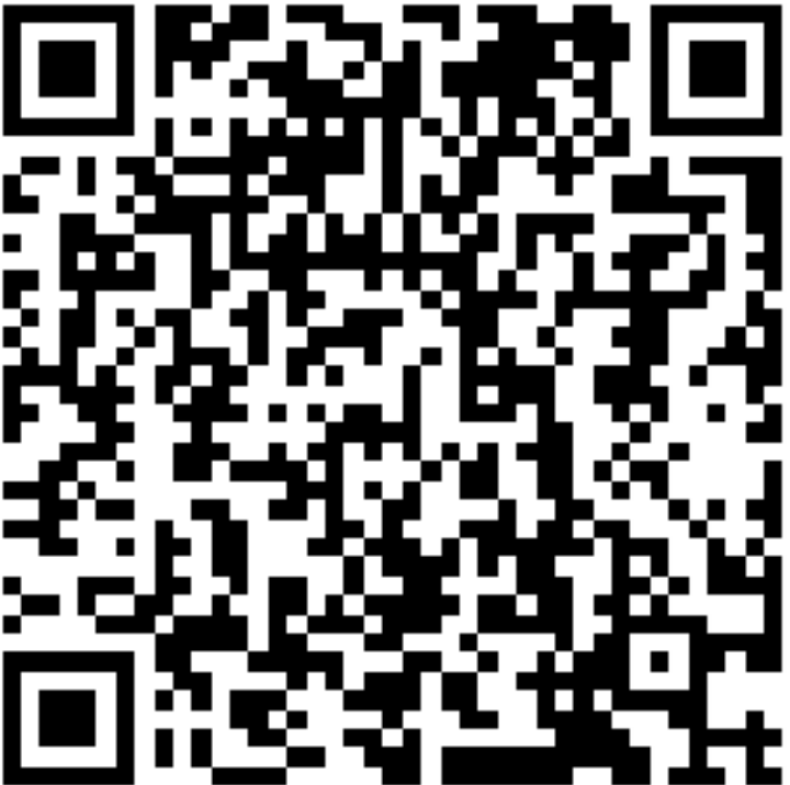
Datenzugangsansprüche nach dem Data Act